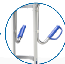
ASA DE PISTOLA