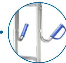
ASA DE PISTOLA